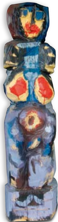
Gernot Riedmann, Die Ahnin – Urmutter, Holz bemalt, 147 x 37 x 30 cm, Foto: privat