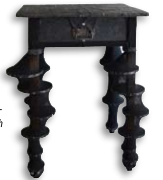
Uta Belina Waeger, Alles C(o)rona, Diverse Fundstücke auf verhäutetem Schrein; Holztisch verkleidet, 70 x 40 x 13 cm & 79 x 60 x 45 cm