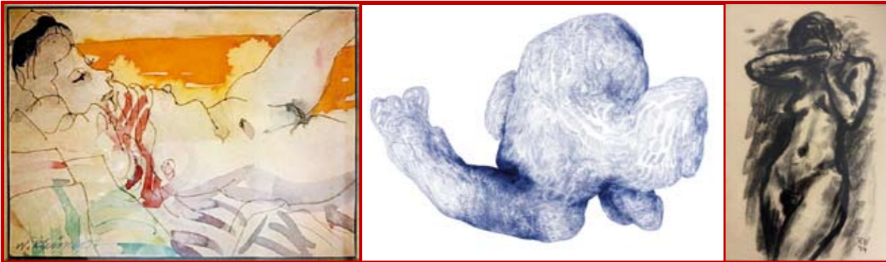
von links nach rechts: Walter Khüny, Ohne Titel, Mischtechnik, 14,5 x 20,5 cm, Foto: privat | Michaela Kessler, Lemb, 2025, Kugelschreiber auf Papier, 50 x 70 cm, Foto: Günter König | Rudolf Wacker, Stehender Frauenakt (1938), Kohlezeichnung auf Papier, 44 x 29 cm, Foto: privat