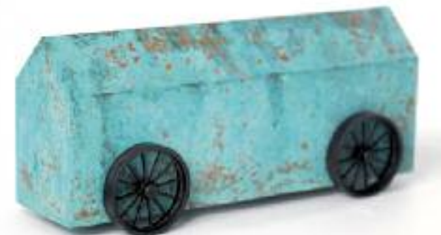
Jan M. Petersen, mobile home, o.J. . Bronze patiniert, Stahlguss, 39 x 18 x 14 cm

Die knallig bunten „Bubbleheads“ sind seine Erfindung und sein Markenzeichen. Der Karikaturist, Grafiker und Maler nennt sie „Kopffüßler“, bestehen sie doch auch nur aus einem Kreis, der zugleich Kopf und Körper darstellt. Hinzu kommen eine Art Tentakeln als Gliedmaßen. So habe er auch schon als kleiner Junge gemalt. Wie es im Übrigen fast alle Kinder tun. Es ist die knappste Form, einen Menschen abzubilden. Sie treten in allen Kulturkreisen und Zeitepochen auf.