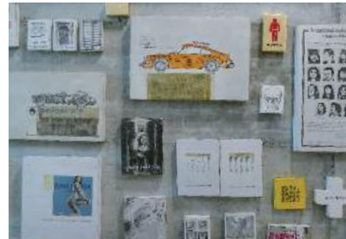
Jan M. Petersen, Kunstkaufhaus-Ost (Ausschnitt), o.J., Mischtechniken, Collagen, Grafik, div. Formate

In den Fokus rückt er die kritische Beleuchtung und ironische Kommentierung alltäglicher Verrichtungen, Konsumgewohnheiten und Politik. Die Begegnung mit den zeitaufwändig hergestellten Arbeiten aus dem „Kunstkaufhaus-Ost“ ruft immer wieder Heiterkeit und Schmunzeln hervor.