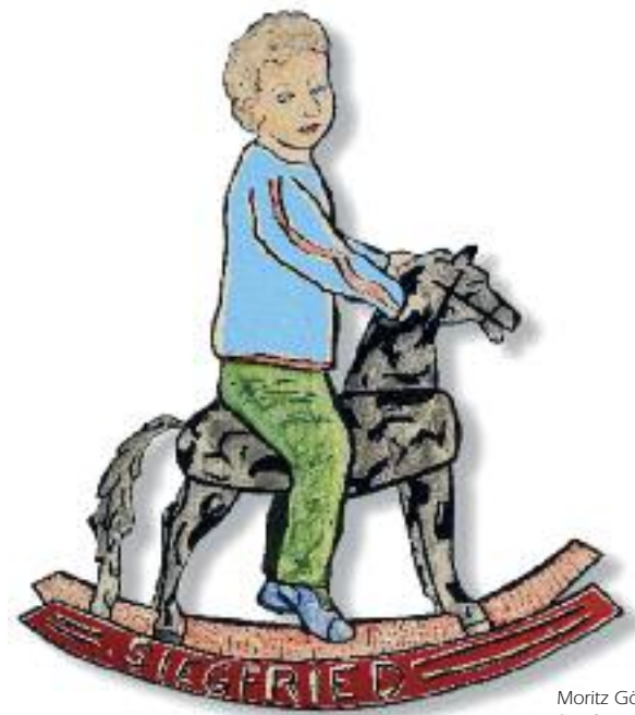
Moritz Götze Siegfried, 2014, Emailmalerei/Stahl, 61 x 54 cm