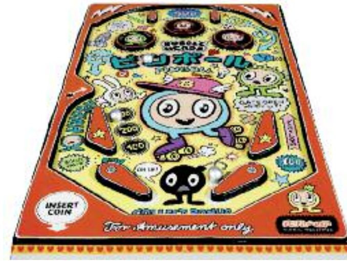
Rainer Weishaupt, Pinball, 2017, Acryl/Holz, 103 x 59 cm

Jan M. Petersen zeigt parallel zur Sammlung eine Reihe bildhauerische Werke aus Corten. Aus diesem wetterfesten Baustahl entstehen Behausungen, teils auf Rädern, teils ohne Fenster. Auch hier wieder begibt er sich auf die Suche nach der gleichzeitigen Widersprüchlichkeit.